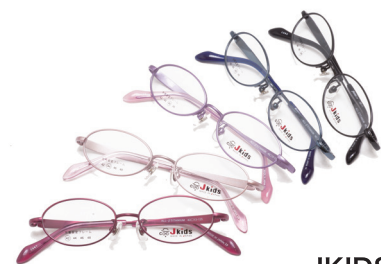
JKIDS 15年愛され続けている ジャムコン定番のこどもメガネ

4~5歳くらいまでのお子様には、樹脂製フレームも宜しいかと思えます。ただし小学校入学後は、メガネの取扱いがしっかりできる世代であり、お子様に合わせたフィッティングができるメタル製フレームが最善ではないか、と考えております。